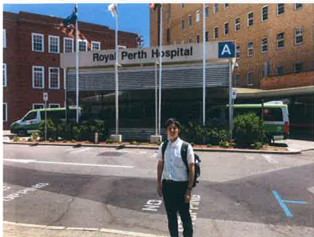
ロイヤルパース病院 ボランティアとのミーティング