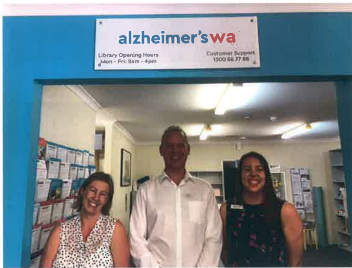
アルツハイマーズWA デイセンター