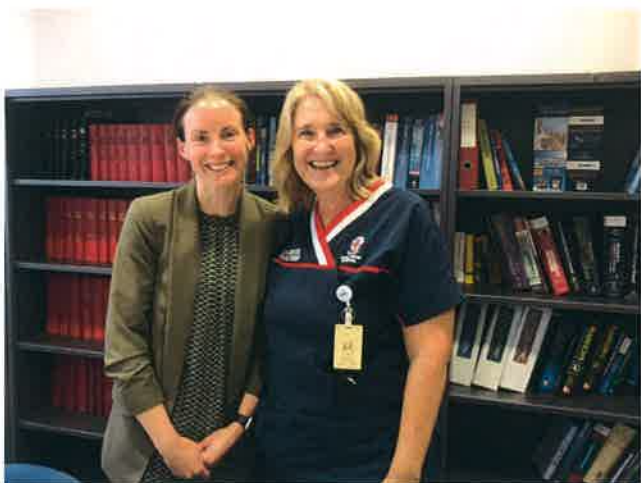
ロイヤルパース病院 フリーマントル病院