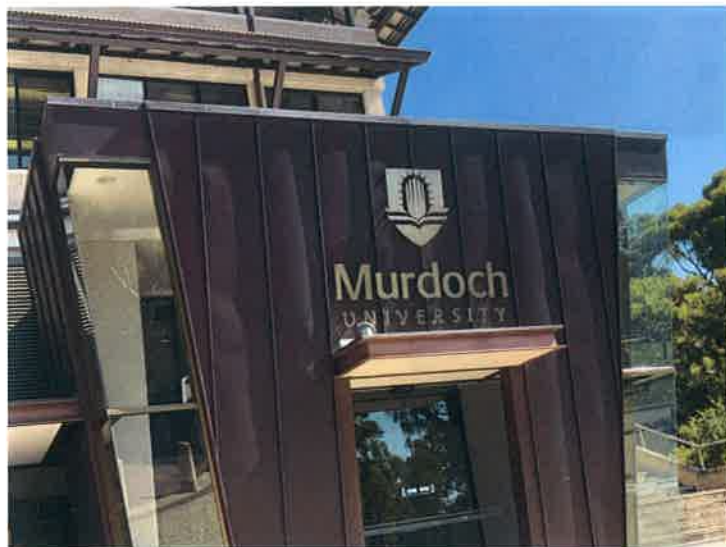
マードック大学 教員とのミーティング