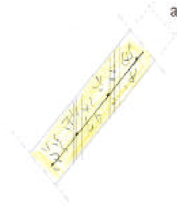
従来工法a=20は、厚層a=50を比例配分し測定