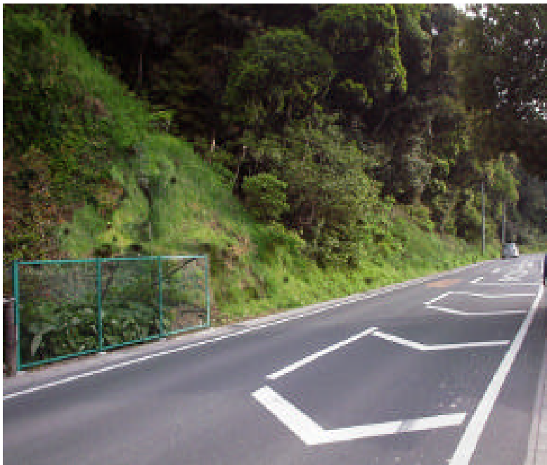
平成14年4月 4年5ヶ月後