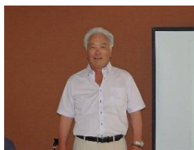
金原全国会長挨拶